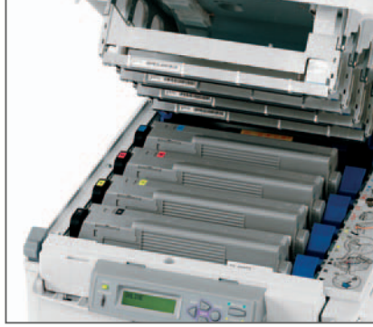
COSTI COPIA b/n e colore tra i più COMPETITIVI del mercato